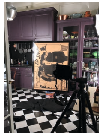
Prise de vue d'une affiche chez un particulier, Paris, mai 2018