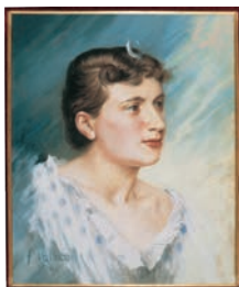
Félix Vallotton, Tête fantaisie , 1890 Pastel sur toile, 47 x 39 cm Fondation Félix Vallotton, Lausanne