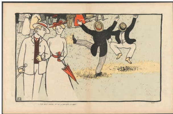
Félix Vallotton, « Quel genre! crois-tu; ... et tout ça parce qu'ils ont gagné! », dessin paru dans Le Canard sauvage (Paris) le 7 juin 1903