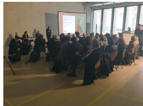
Annnonce de la rétrospective Félix Vallotton de 2025. Conférence de presse, Musée cantonal des Beaux-Arts (encore en chantier), Lausanne, 26 novembre 2018

« Cesla Amarelle [Conseillère d'État à la tête du Département de la formation, de la jeunesse et de la culture du Canton de Vaud] a conclu cette conférence de presse en annonçant une exposition d'une rare envergure, à l'occasion du centenaire de la mort de Félix Vallotton en 2025. Grâce à la collaboration entre la fondation qui porte son nom et le mcb-a, qui possède la plus importante collection d'œuvres de cet artiste, ce magnifique hommage démontrera l'importance de ce nouveau centre de compétence, né du rapprochement entre les deux institutions au sein du même bâtiment. »