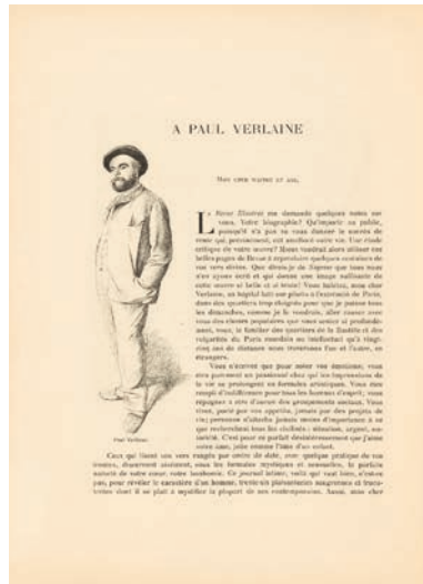
Félix Vallotton, Paul Verlaine , dessin paru dans la Revue illustrée (Paris) le 1 er septembre 1890