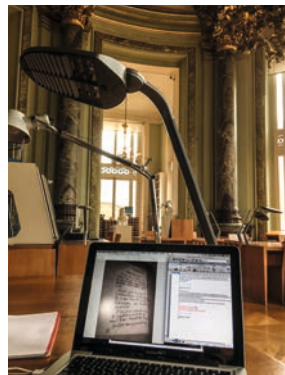
Bibliothèque-musée de l'Opéra Paris, mai 2018