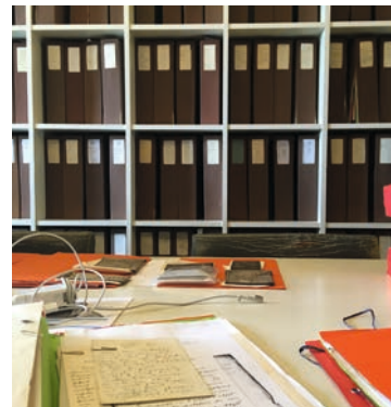
Documentation du musée d'Orsay Paris, mai 2018