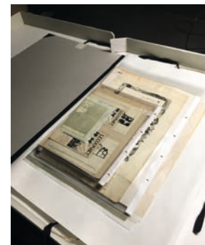
Studio photo de l'Institut suisse pour l'étude de l'art (SIK-ISEA), Zurich, septembre 2018

En septembre, après due préparation à la Fondation de la commande, le photographe Patrice Maurin Berthier a réalisé 37 prises de vues au Musée départemental Maurice Denis, à Saint-Germain-en-Laye. Enfin, Katia Poletti s'est rendue à Paris en novembre pour accompagner le photographe Jean-Louis Losi chez plusieurs particuliers au domicile desquels ont été photographiées des œuvres originales – dessins et projets d'affiches.