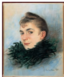
Félix Vallotton, Tête fantaisie, femme au boa , 1890 Pastel sur toile, 46 x 38 cm Fondation Félix Vallotton, Lausanne